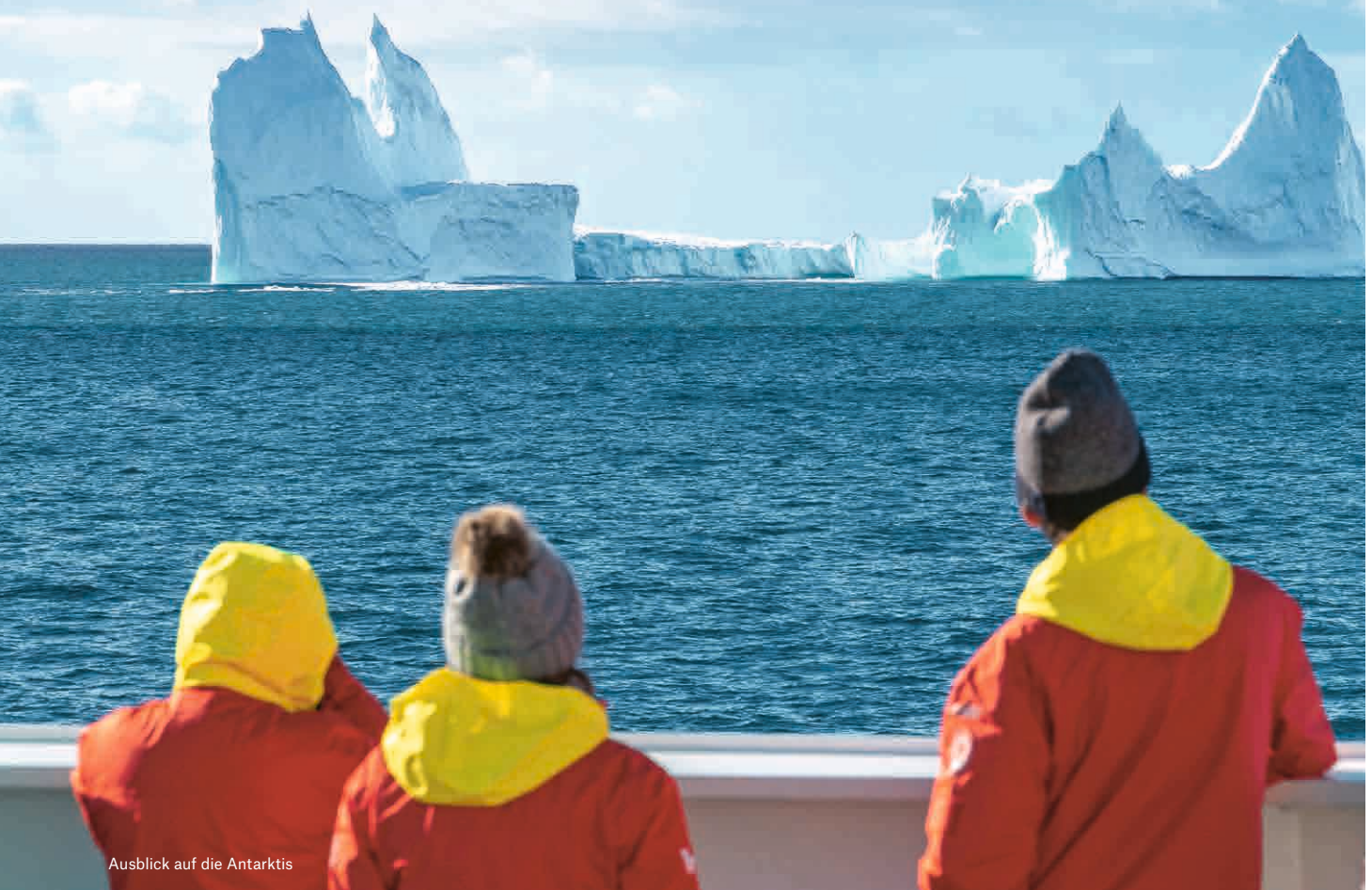
Ausblick auf die Antarktis